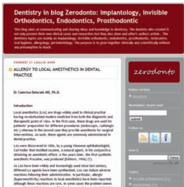
LA VIDEATA DEL BLOG