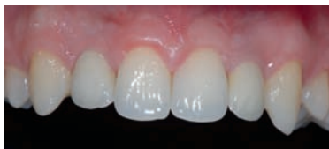
CASO CLINICO 1: AGENESIA DEI LATERALI TRATTATA CON RIABILITAZIONE IMPLANTO-PROTESICA