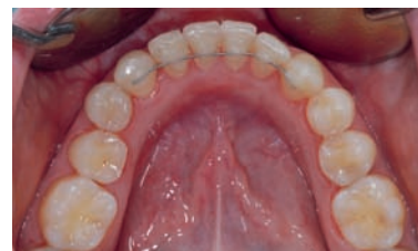
CASO CLINICO 2: CASO DI ORTODONZIA INVISIBILE LINGUALE SENZA ATTACCHI